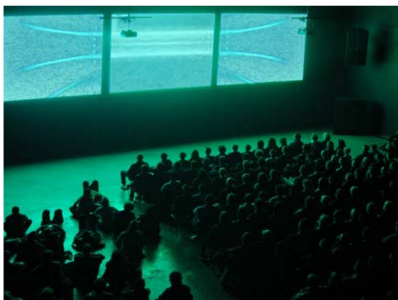
ELEKTRA 2001 - FaustTechnology - PurForm